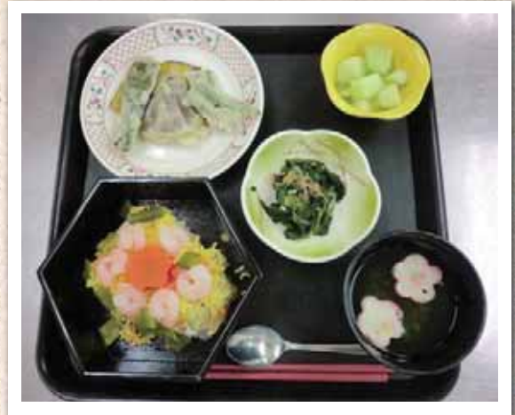
夏の納涼御膳(8月30日)

ちらし寿司・夏野菜の天婦羅盛り合わせ・ほうれん草とオクラのお浸し・清汁・オレンジ