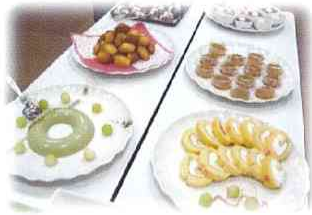
おやつバイキング