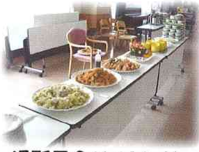
通所昼食バイキング