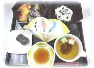
敬老の日 六角弁当