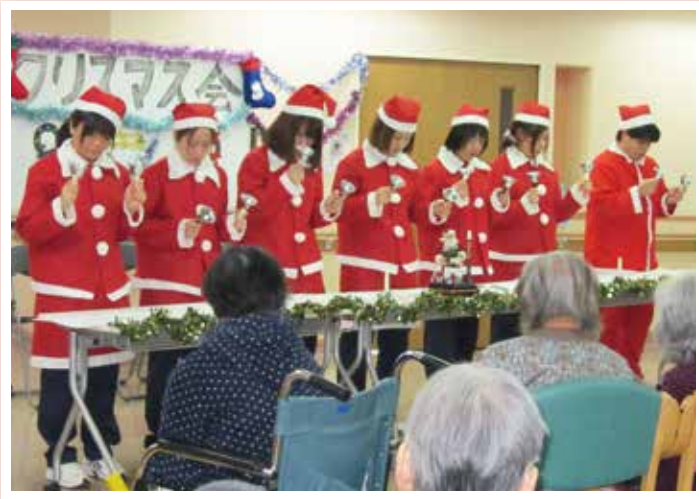
冬の雰囲気には合う透明感のある合唱と、ハンドベルの音色に会場は包まれていました。

平成24年12月25日(火)に開催しました。当日は、習志野少年少女合唱団さんによる合唱、風船友の会さんによるバルーンアート、職員によるハンドベル演奏を披露させていただきました。また、ささやかではありますが、皆様へクリスマスカードとクリスマスプレゼントの贈呈をさせていただきました。