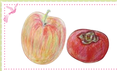
近藤伴子様 の作品